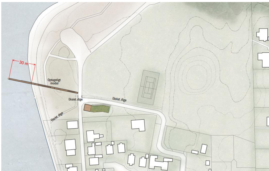
Fig. 1: projektets beliggenhed

Projektområdet omfatter af del af matrikel nr. 3fz Skiften Hou.